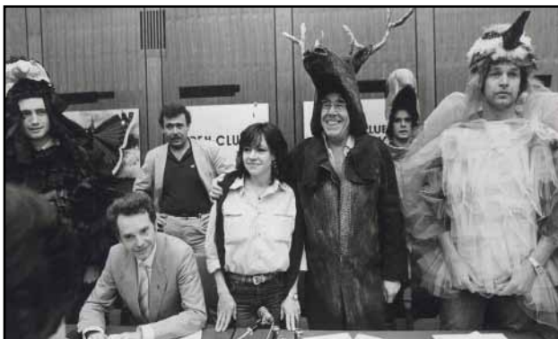
Die Pressekonferenz der Tiere

Elf Tage lang hielten im Dezember 1984 tausende Menschen die Stopfenreuther Au besetzt, um den Bau des Donaukraftwerks Hainburg zu verhindern. Sie demonstrierten, dass ihnen die Erhaltung einer lebenswerten Umwelt wichtiger war als ein System, das immer mehr Dinge erzeugt, um damit immer mehr Dinge zu erzeugen. Trotz winterlicher Kälte, trotz mehrerer Räumungsversuche durch die Gendarmerie, trotz einem bis dahin beispiellos brutalen Polizeieinsatz hielten sie durch, unterstützt von der Bevölkerung von Stopfenreuth und Hainburg, unterstützt von zehntausenden Menschen in ganz Österreich. Ohne diese Einsatzbereitschaft, die zu einem Umdenken in der ganzen Gesellschaft geführt hat, hätte es den Nationalpark Donauauen nie gegeben.