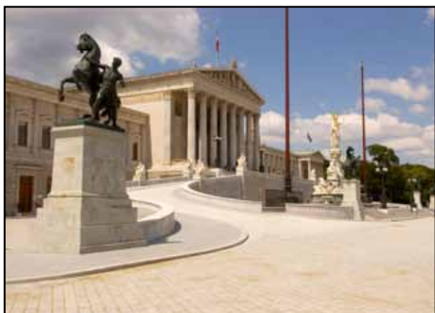
Blick auf die Fassade des Parlamentsgebäudes an der Ringstraße.

Das Parlamentsgebäude wurde 1883 als „k.k. Reichsratsgebäude“ eröffnet. Die Station Parlament berichtet vom Kampf um das allgemeine Wahlrecht in Österreich. Er begann mit der Märzrevolution von 1848 und war 1919 mit der Einführung des allgemeinen, freien, gleichen und geheimen Wahlrechts für Männer und Frauen durch die Erste Republik vorerst vollendet.