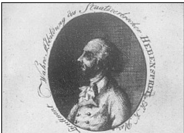
© Österreichische Nationalbibliothek (Porträt von Franz Hebenstreit)

Die Offiziere Kajetan Gilowski und Franz Hebenstreit wurden zum Tod verurteilt. Gilowski nahm sich in der Zelle das Leben. Hebenstreit wurde am 8. Jänner 1795 am Schottentor gehenkt.