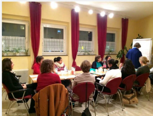
Die Gruppe von lateinamerikanischen Frauen in der Deutschstunde des Projekts „Nachhilfe“ für Immigrantinnen aus Lateinamerika – Teil 1.

Dies ist eine private Initiative, von der das Hilfsprojekt für lateinamerikanische Immigrantinnen ausgeht. Es wurde „Nachhilfe für Immigrantinnen aus Lateinamerika“ genannt und wird von der österreichische zivile Plattform Respekt.net unterstützt.