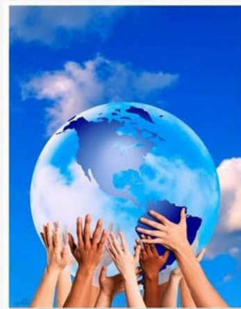
LATEINAMERIKANER IN WIEN BEGLEITEN, UNTERSTÜTZEN

Das Ziel von „Nachhilfe für Immigrantinnen aus Lateinamerika“ ist, lateinamerikanischen Frauen, die in Wien leben, zu helfen und ihnen bei deren Integration in Österreich zu unterstützen. Lateinamerikanische Immigrantinnen erhalten dabei kostenfrei Deutsch-Nachhilfe, und der Kurs wird von einer spezialisierten Lehrerin gehalten. Zusätzlich wird ihnen bei bürokratischen Hürden geholfen, und es gibt die Möglichkeit, kulturelle Veranstaltungen zu besuchen. Ein Team übernimmt diese Aufgaben, und arbeitet unentgeltlich dafür.