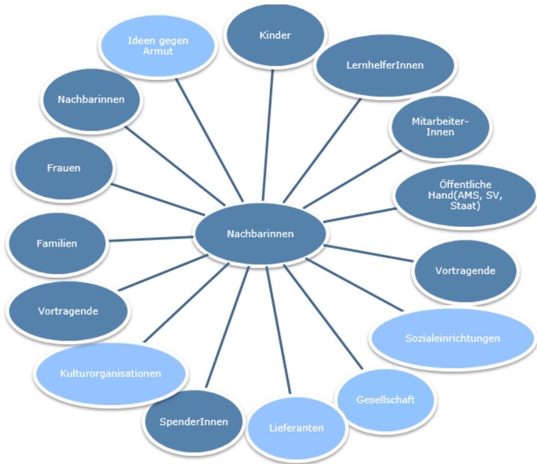
Abbildung 4-1: Keystakeholder